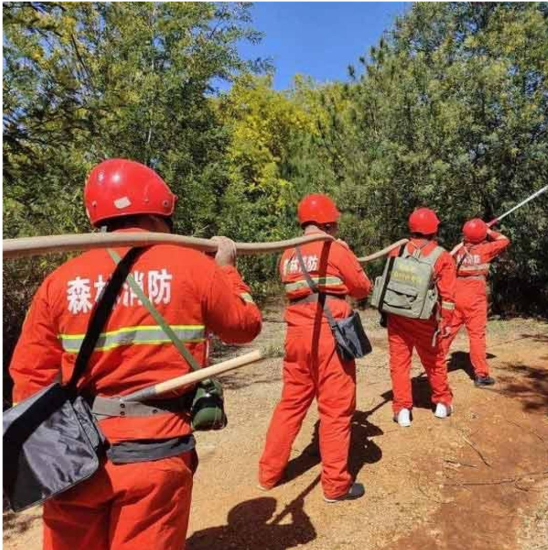
图二 尺寸 600*600 的，体积为 50kb 图片